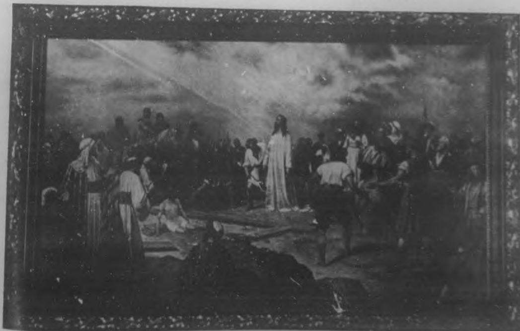
Copia del famoso cuadro "El Gólgota", del notable pintor alemán Jof. Machauserr, que se exhibe en "El Arte"

Administrador de "La Nota Rotaria", Secretario del Gobernador y Administrador del Club de la Habana, a cuya actividad y silencioso y fecundo trabajo se debe en gran parte la efervescencia de entusiasmo que reina actualmente entre los Clubs. No falta quien ha dado en llamarle: "Gran Ministro de Hacienda" del Rotarismo.