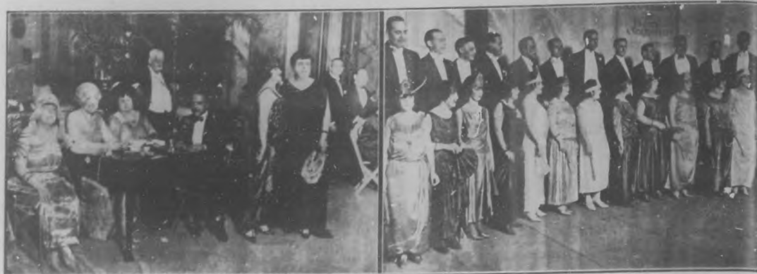
EL BAILE EN FAVOR DEL ASILO TRUFFIN. —La mesa situada a la entrada del teatro donde eran vendidos los carnets por distinguidas damas y caballeros.