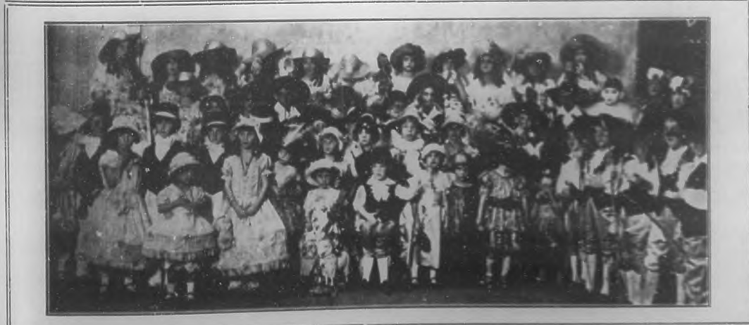
Grupo de niños que concurrieron el pasado domingo al baile infantil efectuado en el teatro "Nacional", a beneficio del Asilo Truffin y que constituyó una fiesta muy suntuosa y simpática.

No un solo palco disponible, todos, absolutamente todos ocupados por lo más selecto de nuestro gran mundo.