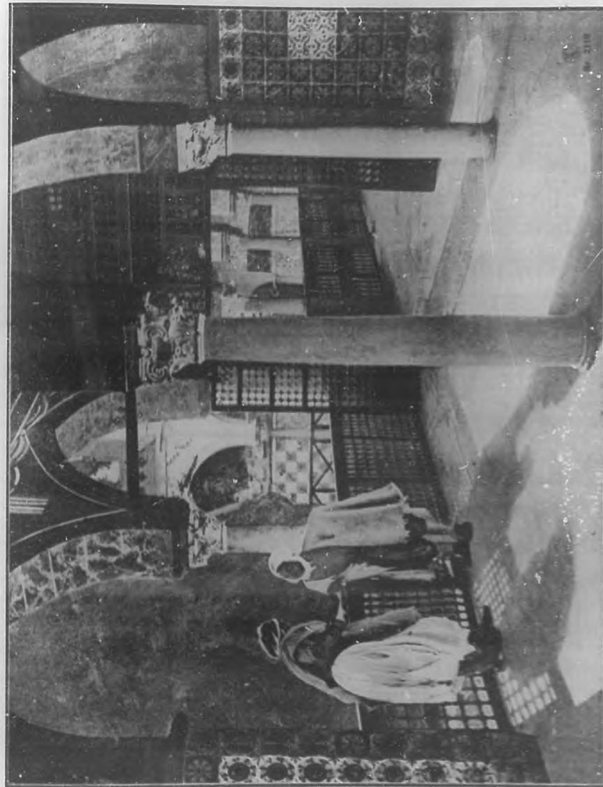
(Grabado inspirado de BOHEMIA)