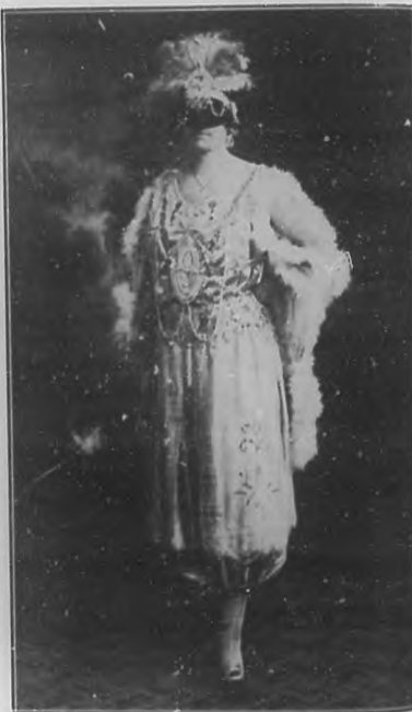
DISFRAZ DE ODALISCA

Méjese. Es lo primero que debe hacer: dejar de verlo. Y propóngase fijarse más en los defectos de él que en las buenas cuali-