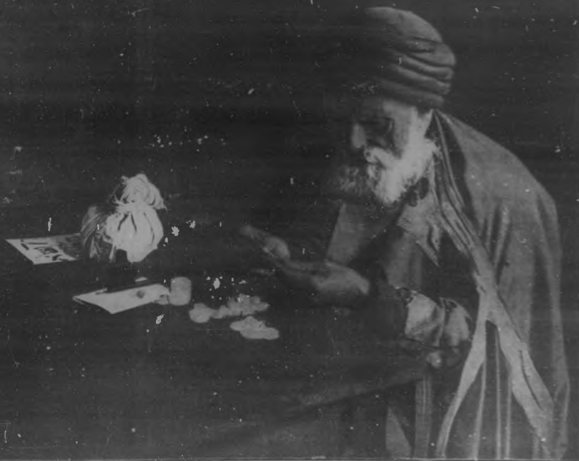
UN AVARO MUSULMAN