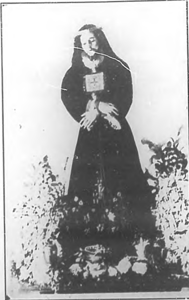
El milagroso Jesús Nazareno tan venerado en la Habana.

Encantada de la vida.—Matanzas. —Acerte usted al suponer que me daría trabajo en atrapar lo que buscaba. Pero, una vez que me decidí con empeño a no perderlo, me fui a la casa de la señora y me quedé allí. Y como ya no había tiempo que perder, me fui a la casa de la señora y me quedé allí. Y como ya no había tiempo que perder, me fui a la casa de la señora y me quedé allí.