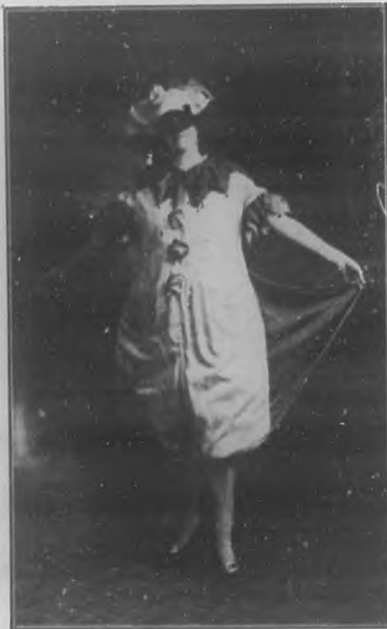
DISFRAZ DE PAYASO FRANCES